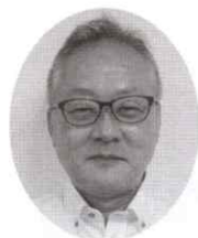
NTT労働組合 関西総支部