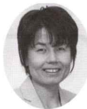
(NTT労組 組織内議員) 立憲民主党 参議院議員

最後に、今後においても多くの取り組みに退職者の会大阪支部協議会と十分にコミュニケーションを図りながら、共に活動をすすめていくことをお誓いするとともに、本年も会員皆さんが健康で元気に過ごされることを祈念します。どうぞよろしくお願ひします。