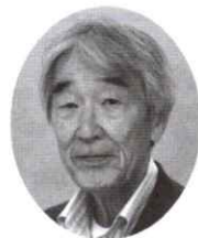
NTT労働組合 退職者の会 大阪支部協議会