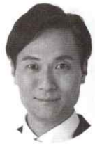
(NTT労組 組織内議員) 立憲民主党 吹田市議会議員

一月から始まる通常国会では、年金制度改革の法案審議も予定されており、医療・介護サービスについても重要な制度改革論議が待ち受けています。私も引き続き、退職者の会の先輩方のご期待にお応え出来るよう、しっかりと頑張っ行ってきますので、今後とものご支援とご指導をどうか宜しくお願いいたします！