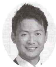
(NTT労組 退職者の会・会員) 大阪府議会議員 枚方選挙区

今年一年、皆様のご健勝とご多幸、そしてNTT労働組合退職者の会大阪支部協会のさらなる発展を心よりご祈念申し上げます。本年もどうぞよろしく願い申し上げます。