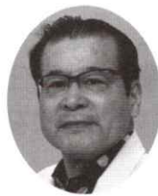
なにわ地区協議会

本年も一日一日大切に的確に各施策に取り組んで参ります。会員の皆様には、いつまでも若々しく、今年もどうかよろしくお願い申し上げます。